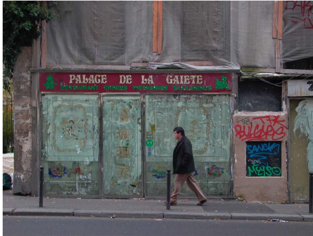
di se stesso